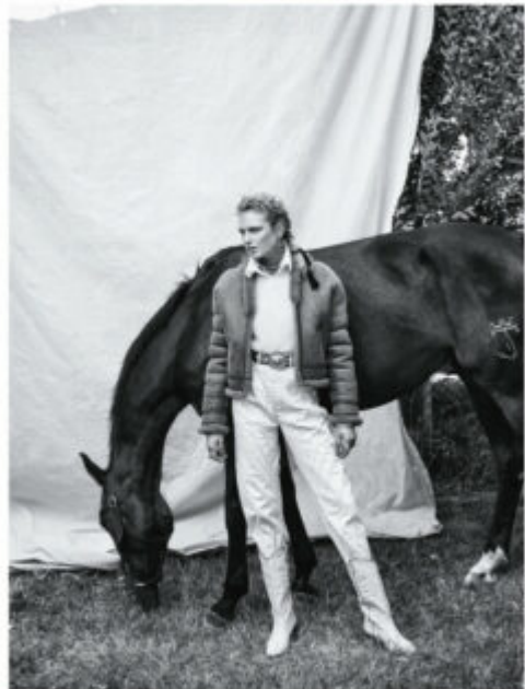
Camiseta de jean: HUGO BOSS; S.TRO; botas de cuero: BIRKENHEAD; VESTIDO: camisa de manga larga: S.TRO; pantalón de jean: JON TAYLOR; pendientes con diamante: MICHIELLE; botas de jean: LACOSTE; calcetín con diamante: S.TRO; pendientes de diamante: APPALOOSA; y aretes de diamante: MICHIELLE.