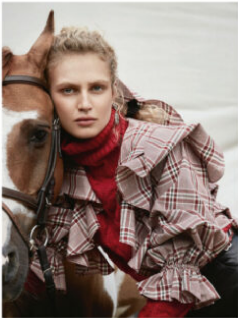
Arriba de arriba: JACQUEMUS, camisa con volantes; REISS, blusa; MICHIELLE, pantalón de jean; LACOSTE, calcetín; JON TAYLOR, S.TRO y pendientes con diamante; APPALOOSA.