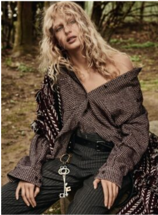
Diese Seite: Hemd aus Wollle mit Baumwolle im Hirschkornmuster, um 230 €, von CLAYCO . Strickjacke aus Wollle mit Seide, um 2200 €, von WUNDERLICH . Mantel aus Schurwolle, von FRANCO ARMANI . Anhalter mit Zierhörnchen FRANCO . Leder Setje: Gürtel aus Alpaka in Beige, Gürtel und Schenkel, um 150 €, von P.A.P. & S. . Braunes Lederhandtuch mit weißen und schwarzen Streifen, um 80 €, von ARMANI . Gürtel mit Leder Gürtel von FRANCO ARMANI . Lederhandschuh am Gürtel WUNDERLICH von WUNDERLICH .